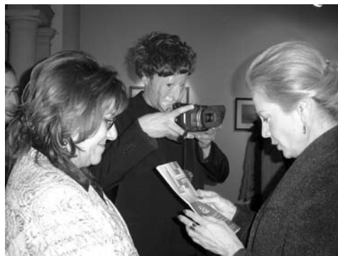
Fotografía alonso+craciun, acción en el Museo Blanes

[6] Montaje de fragmentos tomados de Gilles Deleuze “¿Qué es un dispositivo?”, por Suelly Rolnik, en “Alteridad a cielo abierto. El laboratorio poético-político de Mauricio Dias y Walter Riedweg”. Actar/MACBA, 2003.