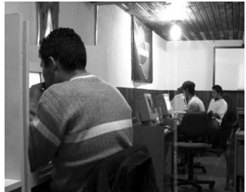
Fotografía en la “Casa de los inmigrantes”

Por último, me infiltré con mi grabadora de mano en la denominada “Casa de los inmigrantes César Vallejo”. Allí, intenté sorprender a quien logré visualizar primeramente, un joven peruano de unos 30 años, que frente a una computadora sostuvo un silencio vergonzoso, ajeno a lo que sucedía... (*)