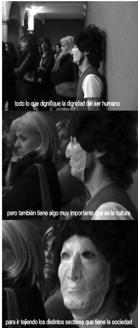
Imágenes capturadas del video/acción en el Museo Blanes. Discurso inaugural ERA 07.

Poco se sabe del hombre invisible, apenas si logramos deducir que prefiere el nihilismo al desengaño y que frente al humanismo opta por la máscara. El invisible es un cómic de Manara, una canción de Kiko Veneno, un par de películas clase Z y una parte de nosotros que sigue pidiendo a gritos mudos y sordos el final de muchas historias que seguro jamás podremos escribir.