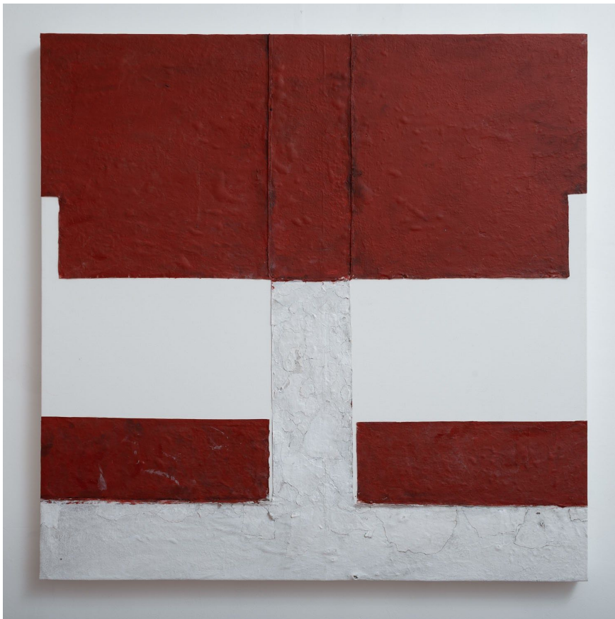
Pablo Rasgado. A fold is a collapse—roof , 2019.

pega, rasca, pinta, añade y marca secciones de paredes que busca en la ciudad con dedicada pasión. Así como un arqueólogo, logra extraer fragmentos de paredes marcadas por el tiempo y su uso. Obtiene de los muros un universo de signos y huellas intencionales para confeccionar un cuerpo de obras que respiran el tiempo de la vida y su uso. Es así que sostiene una preocupación social y constructiva por el espacio construido. Sus obras pueden presentar un contenido social, político o incluso simplemente contener imágenes abstractas, las que el artista decide apropiarse para presentarlas de una nueva forma y en un contexto particular, el del arte. Este modus operandi lo ha llevado a investigar también sobre las arquitecturas livianas temporales del arte, aquellas utilizadas para construir los espacios característicos del sistema del Arte Contemporáneo y que usualmente son destruidas y descartadas al final de las exposiciones. Paredes de yeso, tabiques y muros livianos de galerías, museos y ferias de arte junto a restos de cartelería pintada conforman una materia prima con el que propone una reflexión al interior del ecosistema del arte.