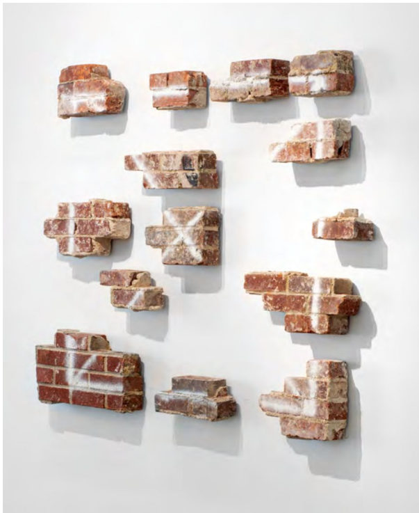
Pablo Rasgado Ventana, 2019. © Piero Atchugarry Gallery

llamó el Arte Destructivo en su texto de 1961 2 . Kemble realiza una reflexión desde la práctica artística sobre un grupo de artistas informales que operaban en Argentina a principio de los años 60, donde expone que el deseo intuitivo de romper, quemar o destruir opera en dialéctica con los placeres de construcción y creación. Kembel sostenía que los artistas están posicionados para traducir las fuerzas destructivas inherentes en la humanidad activamente canalizando los impulsos creativos en forma activa.